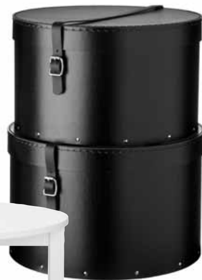
Svarta hattaskar set om två, 299 kr, Granit.

Ett lyckat möte mellan sjutton- hundratals och modern grafisk inredning i svart och vitt.