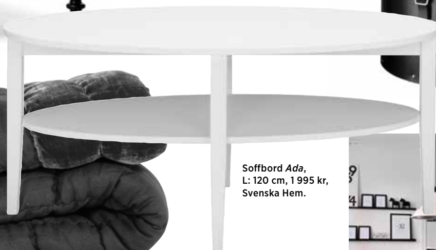
Soffbord Ada , L: 120 cm, 1 995 kr, Svenska Hem.