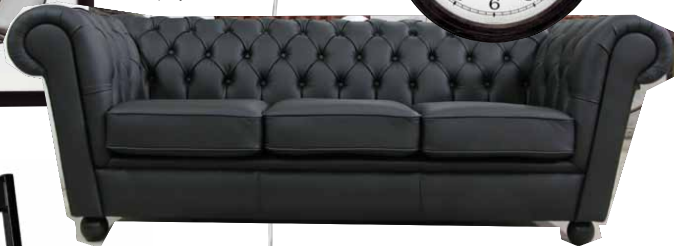
Chesterfieldsoffa Roma , 3-sits i täckmålat läder, 15 990 kr, holyhome.se.