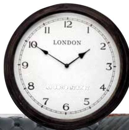
Väggklocka London , diameter 46 cm, 998 kr, Par Courier.