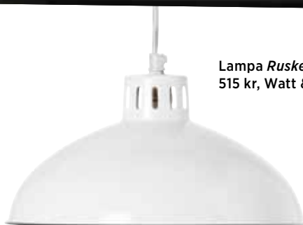
Lampa Rusken , 515 kr, Watt & Veke.