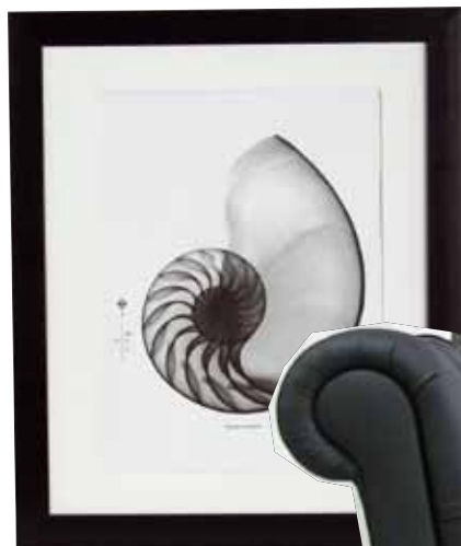
Tavla Shell , 42x35 cm, ca 200 kr, House Doctor.