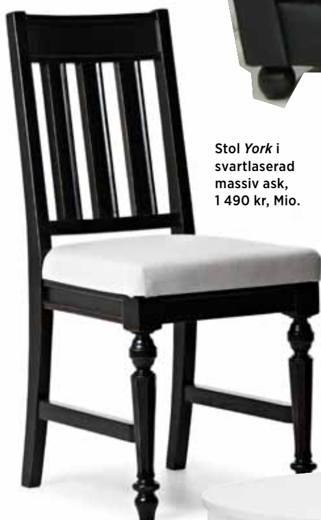
Stol York i svartlaserad massiv ask, 1 490 kr, Mio.