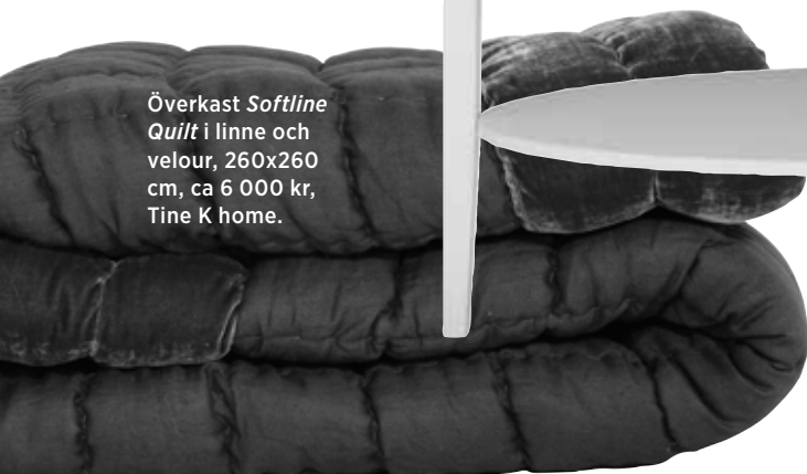
Överkast Softline Quilt i linne och velour, 260x260 cm, ca 6 000 kr, Tine K home.

Ett lyckat möte mellan sjutton- hundratals och modern grafisk inredning i svart och vitt.